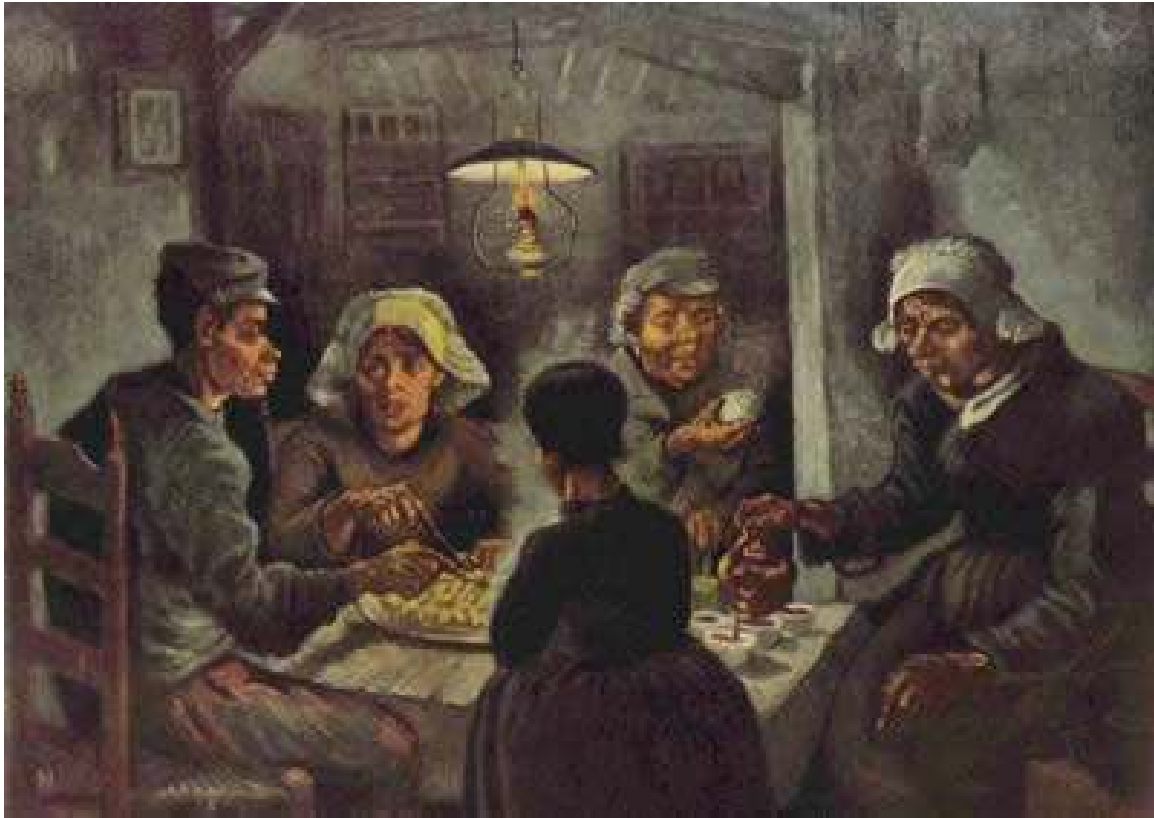
Die Kartoffelesser, April 1885, gemalt in Nuenen von Vincent van Gogh 1